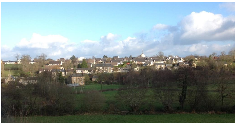
Vue sur la vallée de l'Elle, le village de la Croix de Moon et des Écoles où le 3 ème bataillon du 175 ème Régiment de la 29 e DI prit position au soir du 9 juin 1944

Le lendemain, samedi 10 juin, la 29 e Division d'Infanterie installa ses forces sur la rive droite de l'Elle libérant ainsi toute la partie de Moon située au nord de l'Elle.