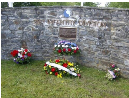
Mur du souvenir à Saint-Jean de Savigny à la ferme du Mesnil.

Enfin, le carrefour de Saint Clair put être pris le samedi 17 juin par les soldats américains grâce à l'appui des chars. Les Allemands qui avaient perdu au moins 60 soldats, se replièrent vers Villiers-Fossard. Aujourd'hui une stèle a été érigée au carrefour Saint-Clair pour ne pas oublier cette bataille, 4 jours de rudes combats, et la libération.