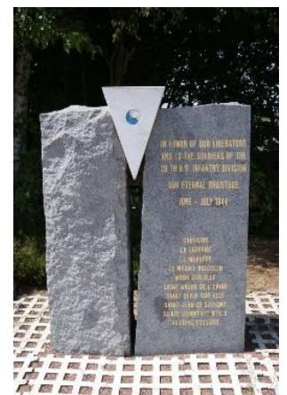
Stèle au carrefour Saint-Clair sur Elle